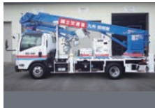
協力：九州地方整備局 J4・S14