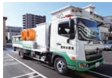
協力：九州農政局 J5・S13