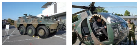
協力：陸上自衛隊 J8・S12