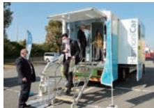
協力：肥後銀行 S10 (20日のみ)