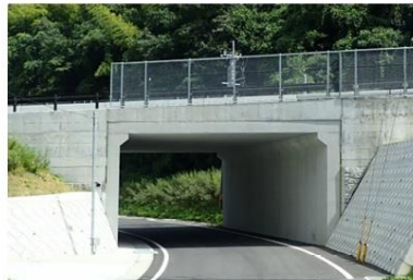
事例：九州中央自動車道 (内空幅8m×内空高5.6m)