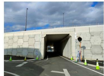
事例：国道3号植木バイパス (内空幅5m×内空高6.75m)