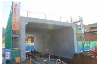
事例：南九州西回り自動車道 (内空幅10m×内空高6.6m)